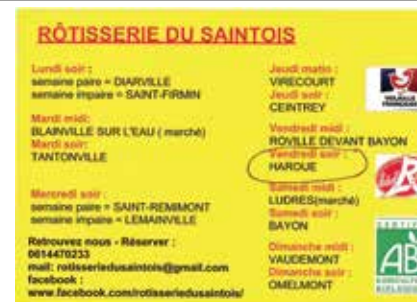
Les vendredis soir

relevez le numéro d'immatriculation et la marque et appelez le 17