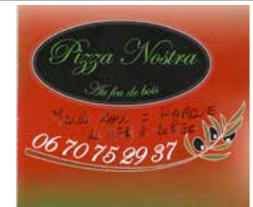
Les mardis soir